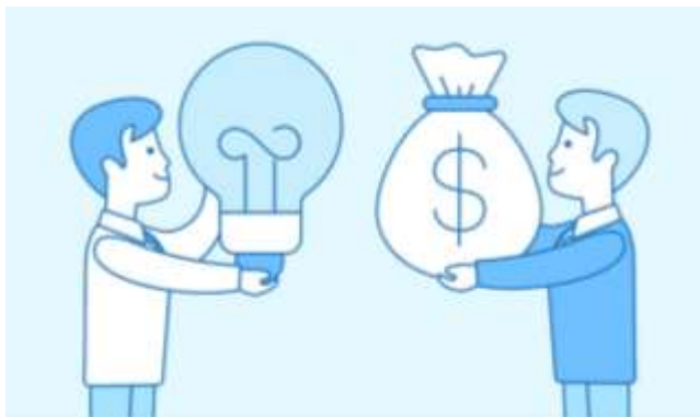
инвесторларға арналған бизнес-жоспар