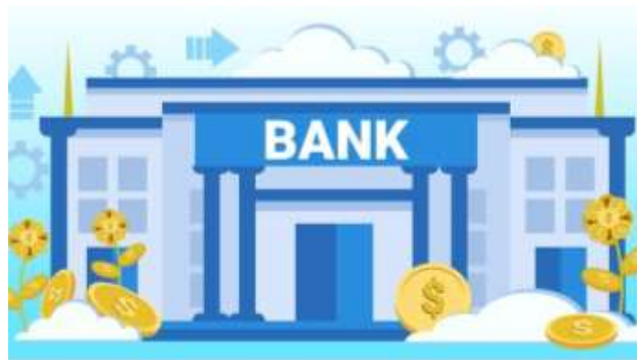
несие алуға арналған бизнес-жоспар