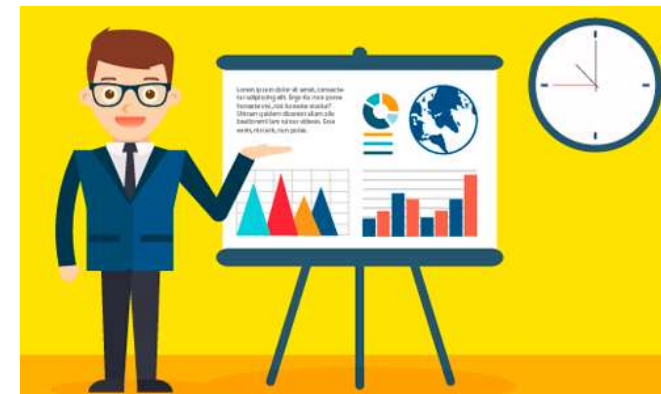
қолданыстағы жобаны сатуға арналған бизнес-жоспар